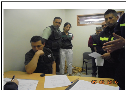
IMG. N° 003 Reinserción Social: Subprograma Laboral, EP Puerto Montt

Comentario: Con fecha 05-01-2016 se realiza en dependencias del modulo 53-54, pago de 102 internos laborales dependientes Compass; en presencia de habilitado Gendarmeria e Inspeccion fiscal.