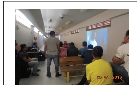
IMG. N° 002 Reinserción Social: Subprograma Deporte, Recreación, Arte y Cultura

Comentario: Con fecha 07-01-2016, Se fiscaliza el inicio de Talleres Club Lector y 2 Talleres Club de Video en los Módulos 1 y 11.