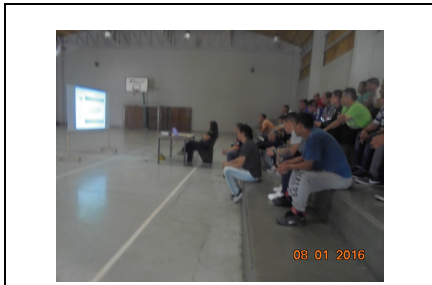
IMG. N° 001 Reinserción Social Subprograma Laboral, EP. Santiago 1.

Comentario: Con fecha 08-01-16 se realizó en Gimnasio del Establecimiento charlas de capacitación para internos trabajadores dependientes, auxiliares de aseo.